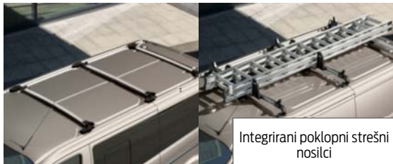
Integrirani poklopni strešni nosilci