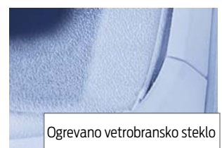
Ogrevano vetrobransko steklo