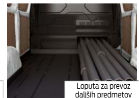
Loputa za prevoz daljših predmetov