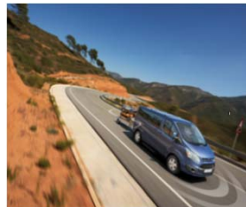
Vlečna kljuka (s programom za stabilizacijo priklopnika TSC)