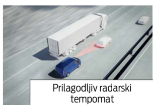
Prilagodljiv radarski tempomat