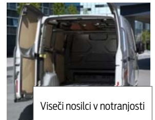
Visoči nosilci v notranjosti