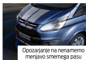
Opozarjanje na nenamerno menjavo smernega pasu