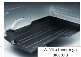
Zaščita tovornega prostora