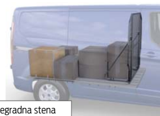
Prilagodljiva mrežasta pregradna stena