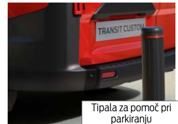
Tipala za pomoč pri parkiranju