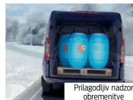
Prilagodljiv nadzor obremenitve