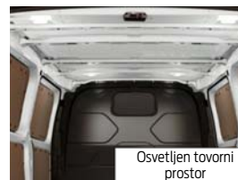
Osvetljen tovorni prostor