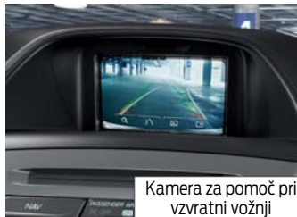
Kamera za pomoč pri vzvratni vožnji